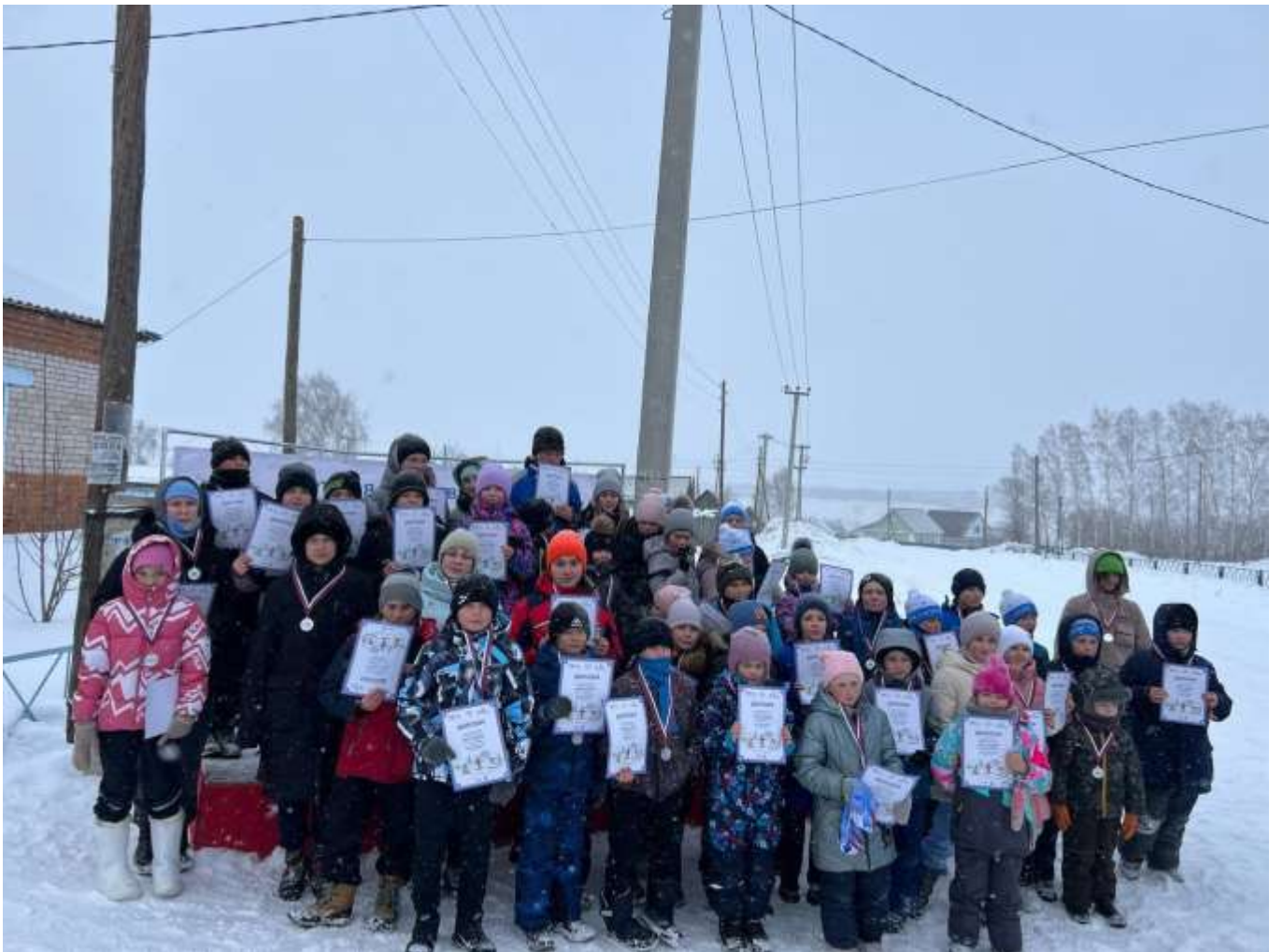
Алтайский край, село Бураново