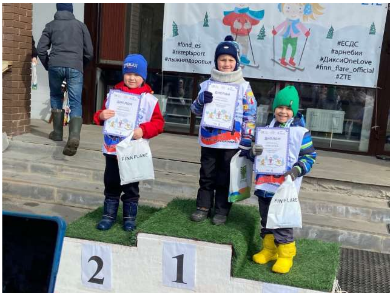
Удмуртская Республика, село Алнаши