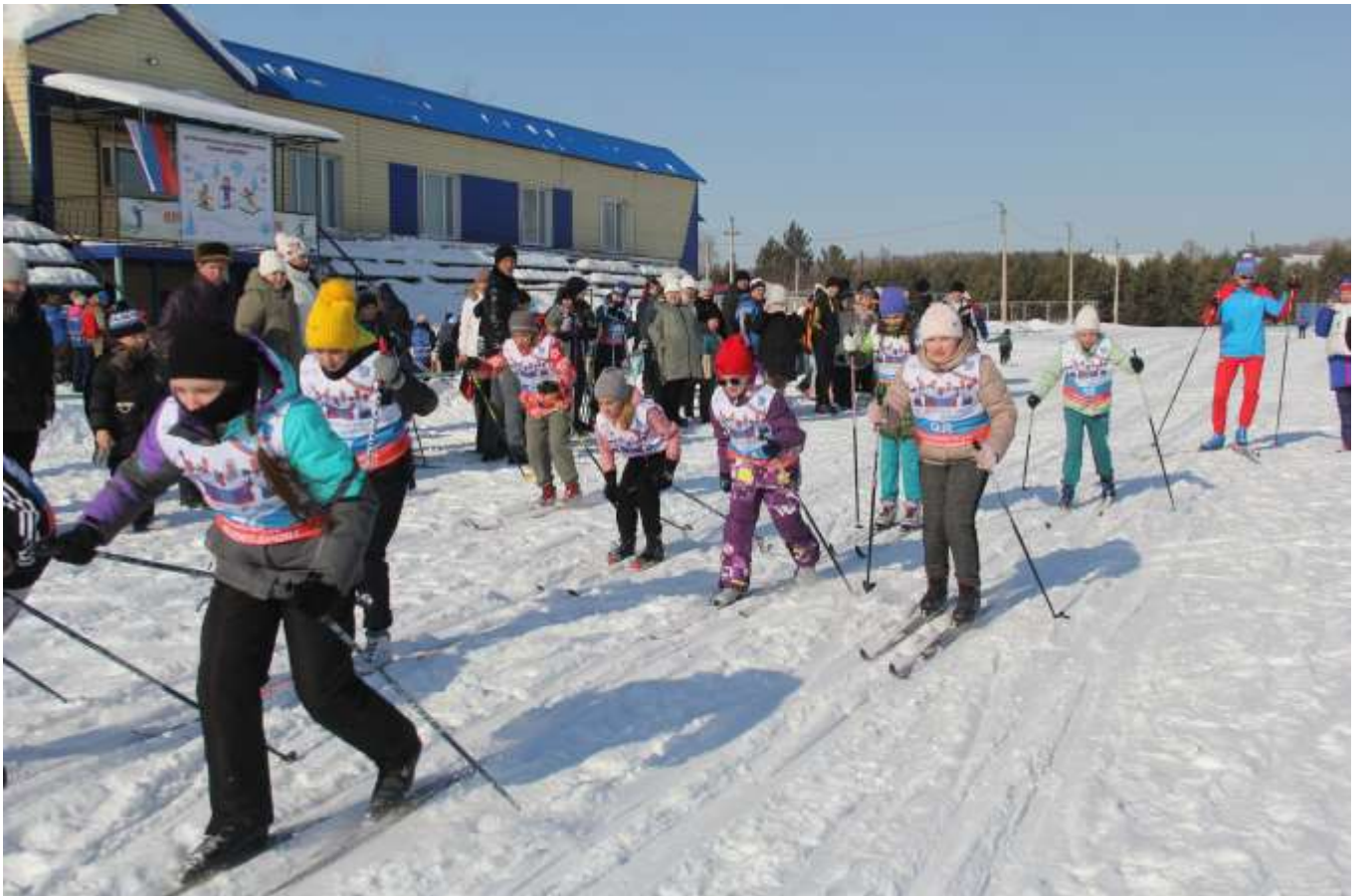
Алтайский край, село Смоленское