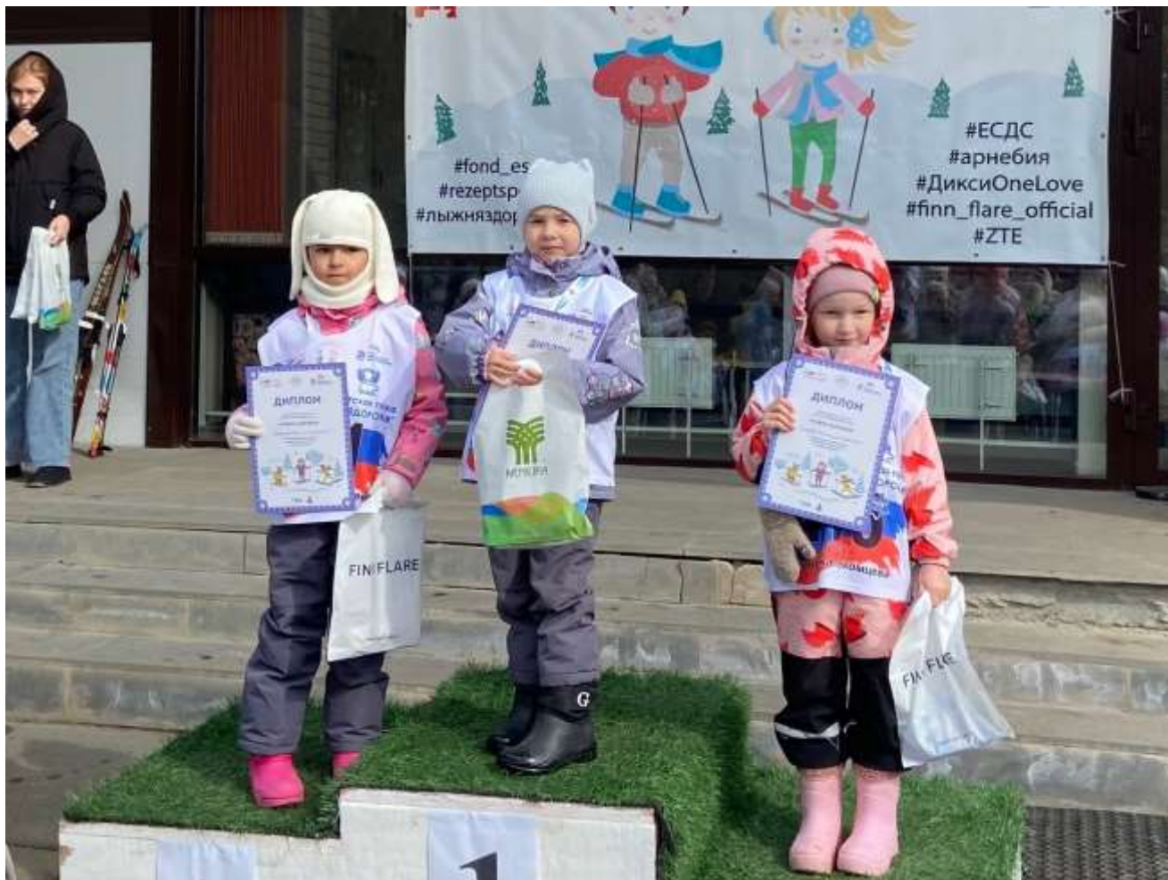
Удмуртская Республика, село Алнаши