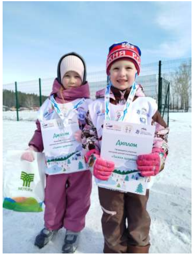
Алтайский край, село Большое Енисейское