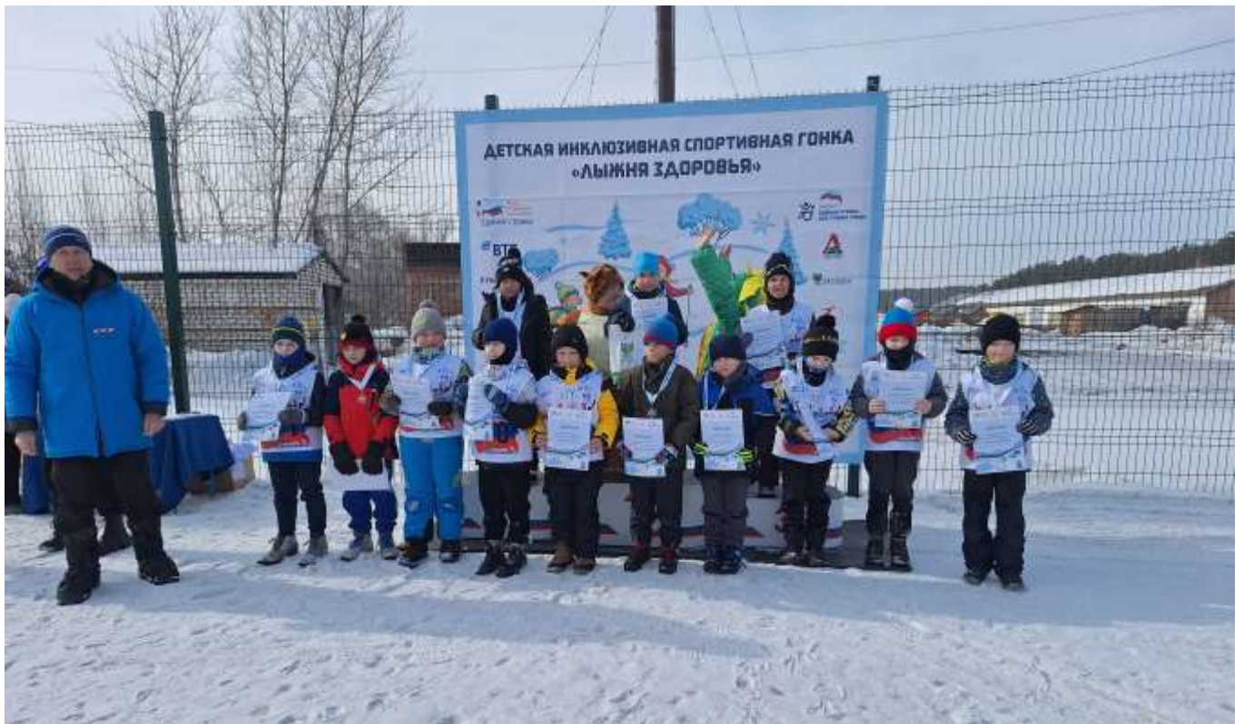
Алтайский край, село Большое Енисейское