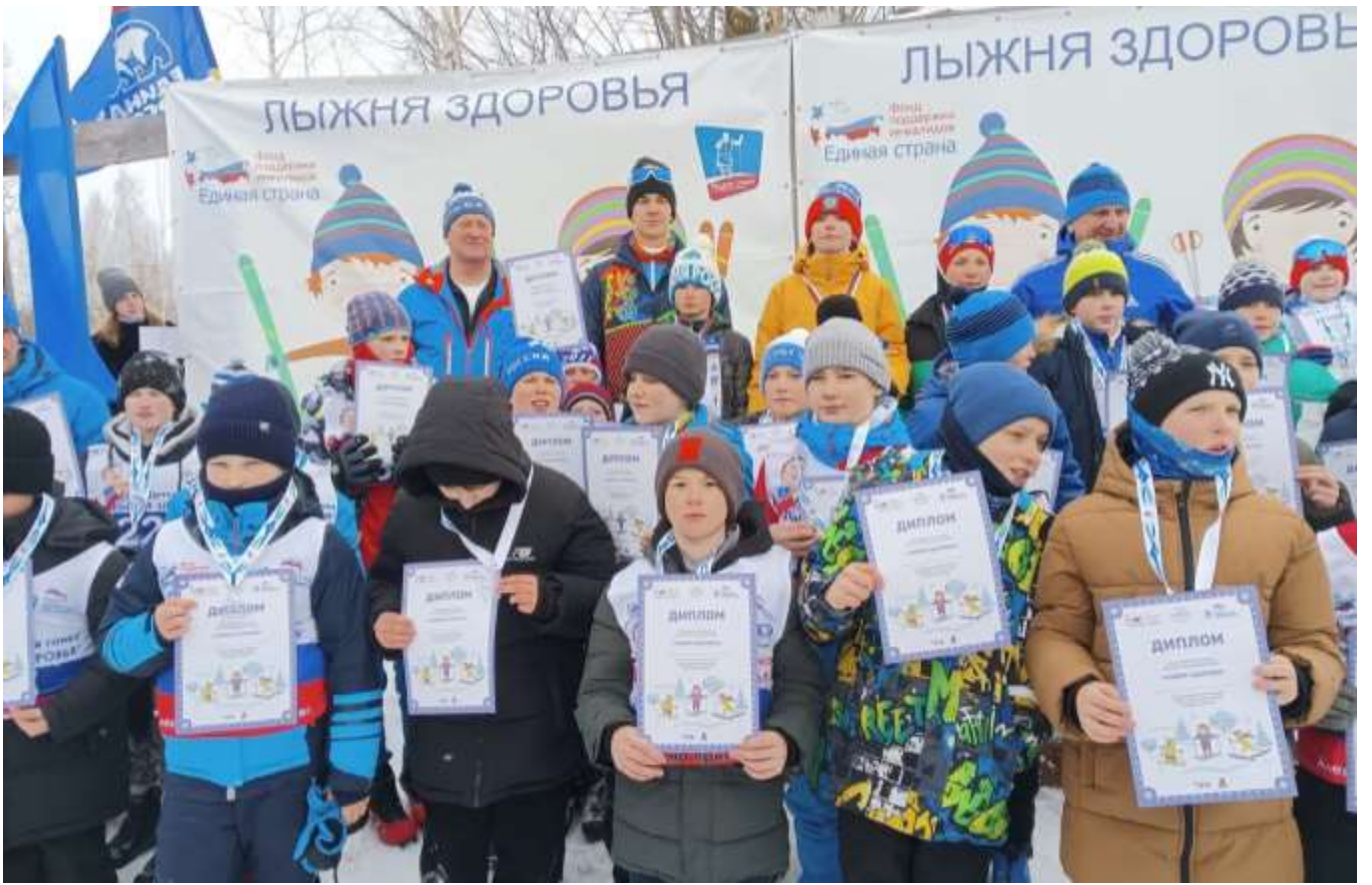
Пензенская область, село Лопатино