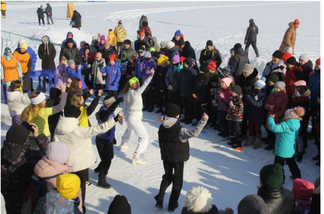
Алтайский край, село Смоленское