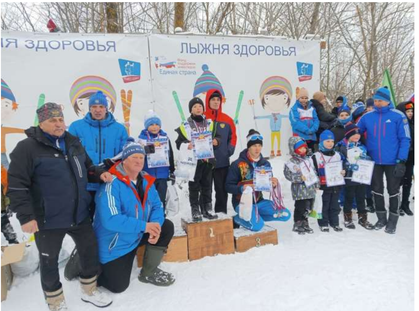
Пензенская область, село Лопатино