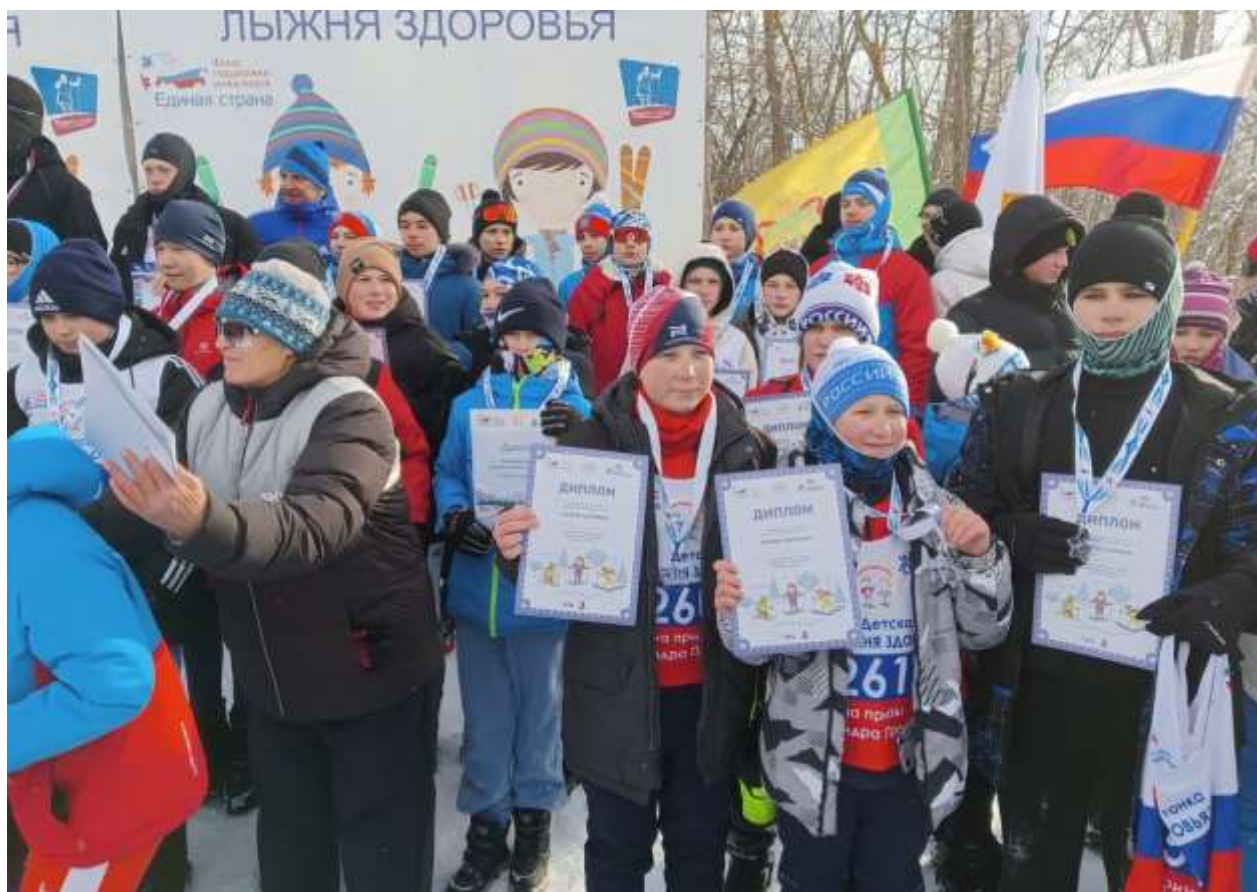
Пензенская область, село Лопатино