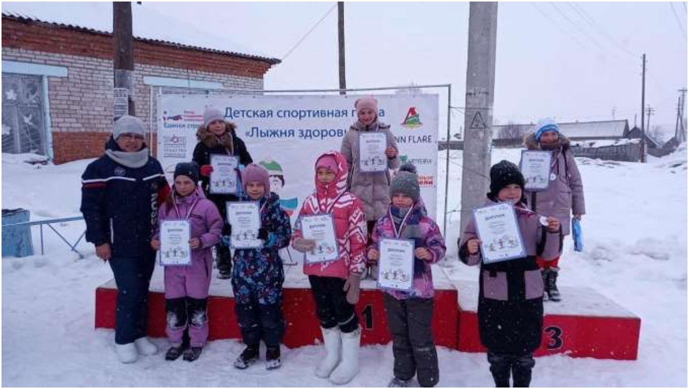
Алтайский край, село Бураново