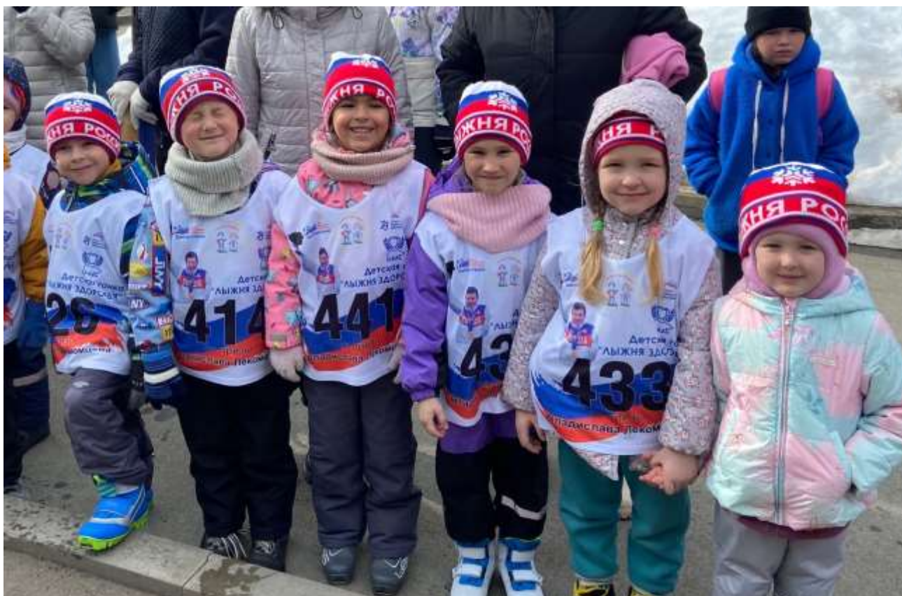
Удмуртская Республика, село Алнаши