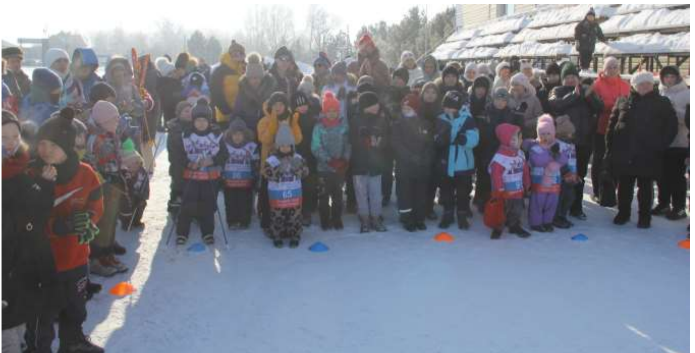
Алтайский край, село Смоленское